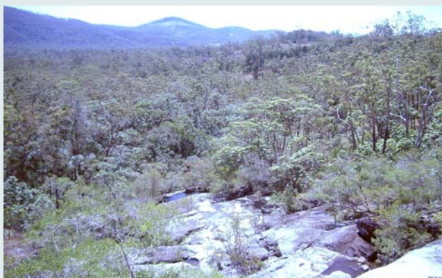
Типичный для Австралии эвкалиптовый лес, западные склоны Большого Водораздельного хребта

В текущем году Геологический институт КНЦ РАН достойно представлял четвертичную геологию России на XVII Международном конгрессе INQUA, проходившем с 28 июля по 3 августа в австралийском городе Кернсе. Международный союз по изучению четвертичного периода существует более 80 лет и является старейшей организацией, объединяющей ученых всего мира, которые занимаются разными проблемами четвертичного периода. На обсуждение мировой научной общественности были вынесены вопросы, наиболее активно разрабатываемые сейчас в Лаборатории геологии и минералогии кайнозойских отложений. В нескольких докладах были представлены результаты исследований интереснейших проблем, касающихся развития морских трансгрессий в течение последних 140 тыс.