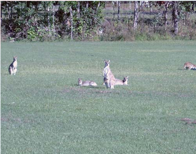
Кенгуру пасутся на полянке

Вообще австралийские животные заслуживают особого интереса. И стоит поехать в Австралию, чтобы только посмотреть на них. Увидеть их довольно просто. Утконосы – обычные зверьки в тропических реках на севере Австралии. Птицы казуары теперь встречаются не часто, зато многие-многие и многие другие птицы гуляют по городам и весям, по полям, они – на всех деревьях. Словом, столько птиц и таких разных я больше нигде не встречала. Более редкие животные здесь вомбаты, розовые панды, но если захотеть, то можно увидеть и их. Разнообразные и многочисленные кенгуру повсюду. На дорожных знаках, предупреждающих о животных на дороге, нарисован не олень, как у нас, а кенгуру.