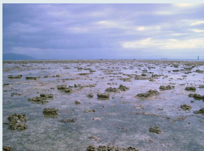
Коралловое море в районе внутренней части Большого Барьерного рифа

В интересном месте расположен и сам город Кернс - во влажных тропиках, на берегу Кораллового моря, у подножия Большого Водораздельного хребта. Это место для пустынной Австралии выглядит, как райский оазис. Глаз радовал окружающий зимний пейзаж. Правда австралийцы жаловались, что в этом году зима у них холодная и температура воздуха ночью опускалась до +15 o . Но такие холода несколько не мешали цвести зимним деревьям, подрастать и созревать