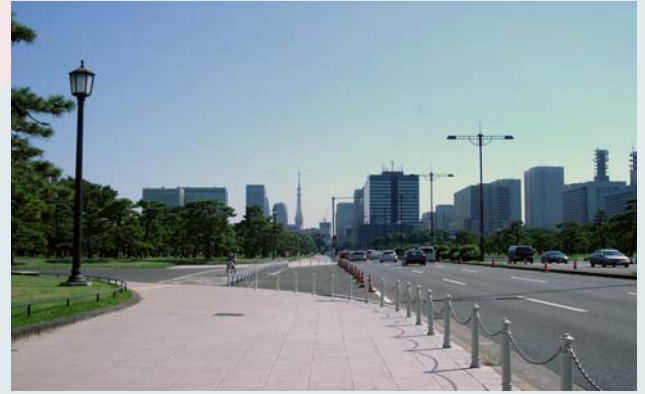
Токио в районе исторического центра Гинза

1. Обязательно используйте любую возможность участвовать в научных мероприятиях, проводимых в Австралии. В таком случае визу получите без проблем. Рассчитывайте на несколько недель – и дело сделаете, и отдохнете, и страну посмотрите.