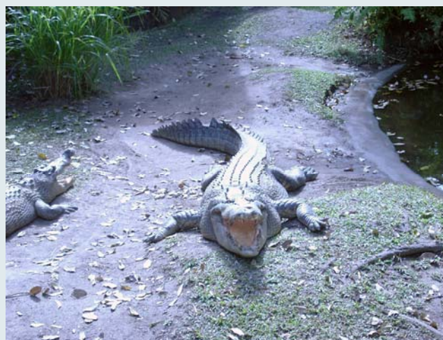
Морские крокодилы на зимнем отдыхе

картофелю на полях, буйствовать сахарному тростнику. Здесь все идет одновременно: на одном участке уборка урожая, рядом – посадка, здесь же и подрастают молодые растения. Очень, кстати, удобно.