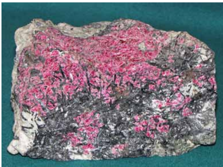
Эвдиалит с эгирином. Хибинский массив. Eudialyte with aegirine. Khibiny massif.