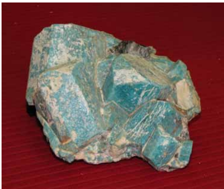
Амазонит. Западные Кейвы, месторождение Парусное. Amazonite. Western Keivy, Parusnoye deposit.