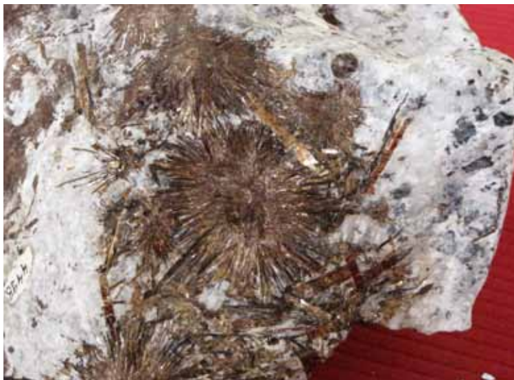
Астрофиллит. Хибинский массив. Astrophyllite. Khibiny massif.