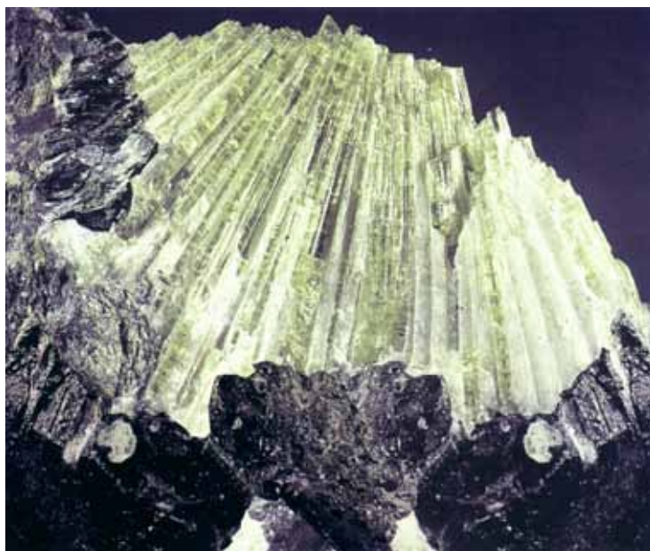
Гидроксилапатит. Ковдорский массив. Hydroxylapatite. Kovdor massif.