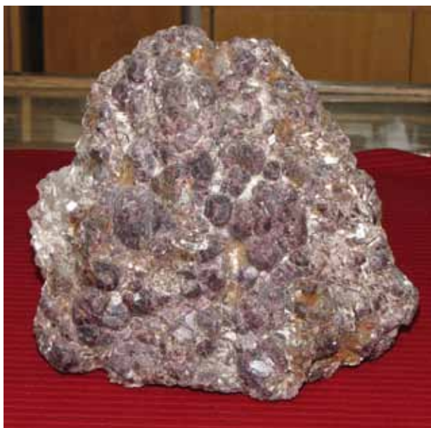
Гранат. Западные Кейвы. Garnet. Western Keivy.