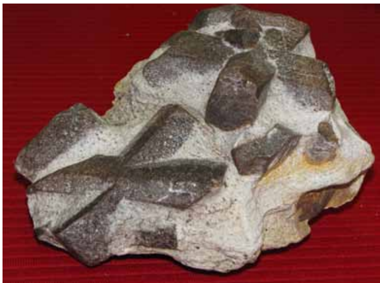
Ставролит. Западные Кейвы. Staurolite. Western Keivy.