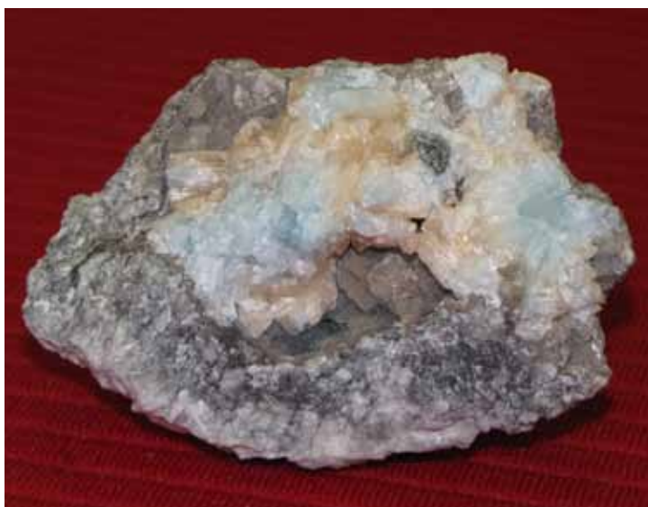
Ковдорскит. Ковдорский массив. Kovdorskite. Kovdor massif.