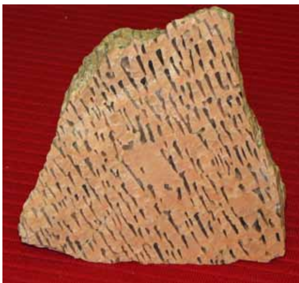
Графический пегматит. Ёнский район, Риколатва. Graphitic pegmatite. Yona area, Rikolatva.