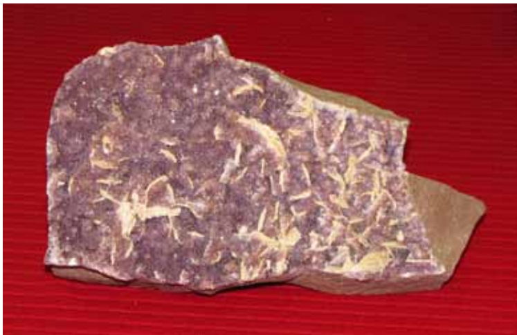
Аметист с баритом. Беломорское побережье, мыс Корабль. Amethyst with barite. White Sea coast, Korabl' Cape.