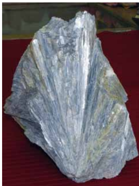
Кианит. Центральные Кейвы. Kyanite. Centraf Keivy.