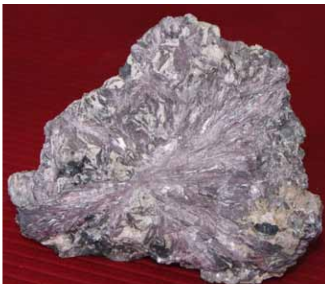
Мурманит. Ловозерский массив. Murmanite. Lovozero massif.