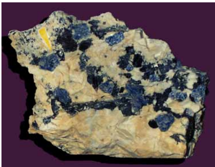
Синий корунд. Хибинский массив. Blue corundum. Khibiny massif.