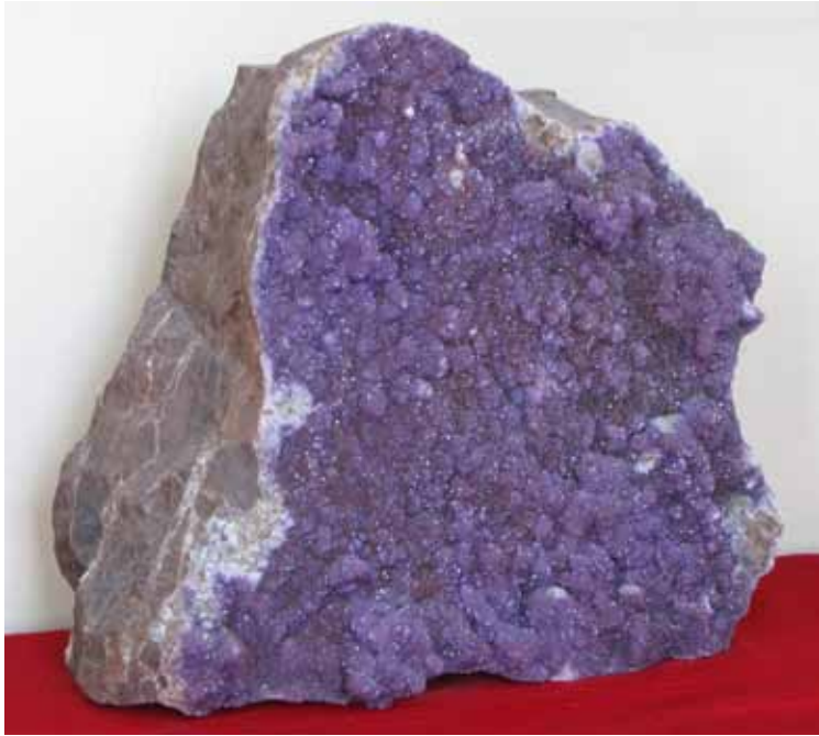
Аметист. Беломорское побережье, мыс Корабль. Amethyst. White Sea coast, Korabl' Cape.