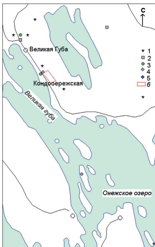
Рис. 1. Схема размещения проявлений в юго-восточной части Святухинско-Космозерской СРД (район пос. Великая Губа).

В геологическом строении района Великой Губы принимают участие шунгитоносные толщи палеопротерозойского возраста, прорванные силлами габбродолеритов (PR 1 ld). Вмещающие породы секутся кварцевыми жилами, образующими штокверки. Вдоль побережья залива накопился постледниковый обломочный материал недалекого переноса, представленный обломками местных пород и жил.