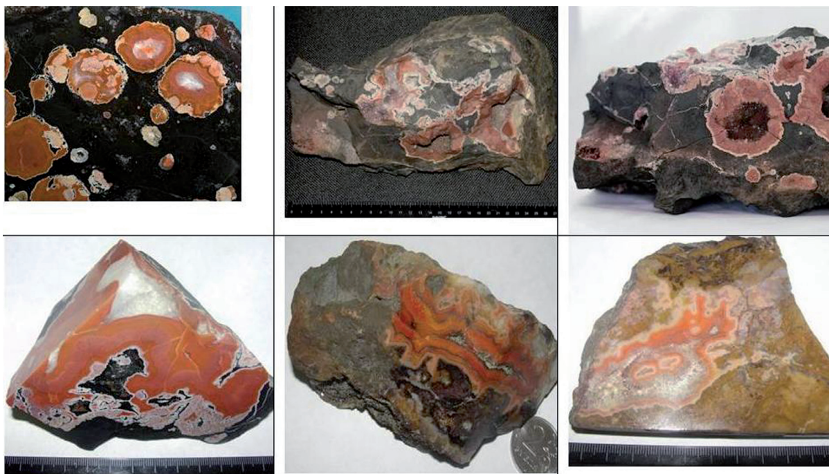
Рис. 4. Карнеол-агаты (проявление Кондобережская).