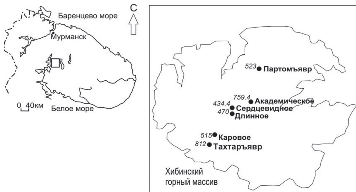
Рис. 1. Карта-схема расположения малых озер Хибинского горного массива и прилегающих территорий с указанием высоты над уровнем моря, м.